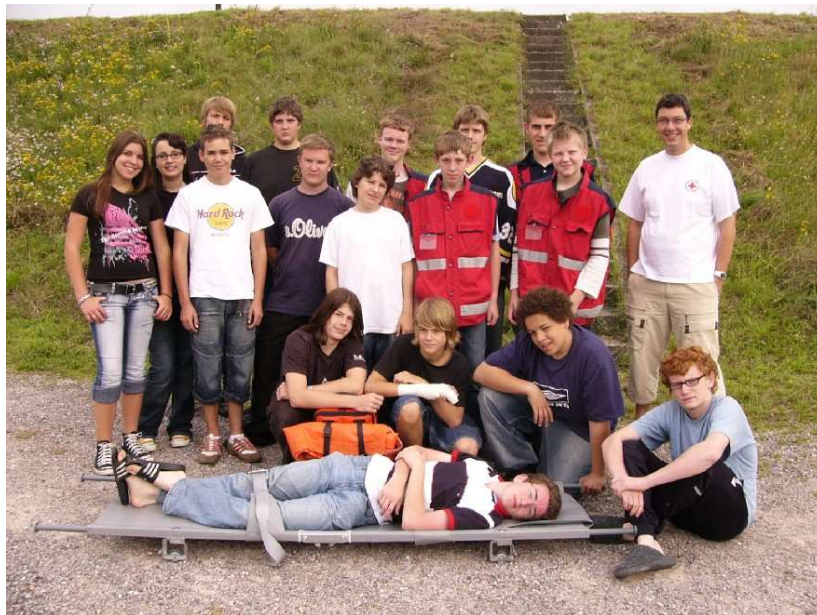
Die Schulsanitäter und Ausbildungshelfer des Schuljahres 2006/2007

Gerade am letzten Ausbildungstermin wurde mir deutlich, dass Schüler besondere Leistung bringen, wenn sie von einander lernen. Ich konnte prinzipiell mehr Fachwissen vermitteln als die Jahre zuvor. Die Schüler haben sich gegenseitig auf abwechslungsreiche Art und Weise selbst ausgebildet. Sie hörten sich ab, erklärten, trainierten ihre Kompetenzen in Fallbeispielen. Hier wurde mit „Kopf, Herz und Hand“ gelernt.