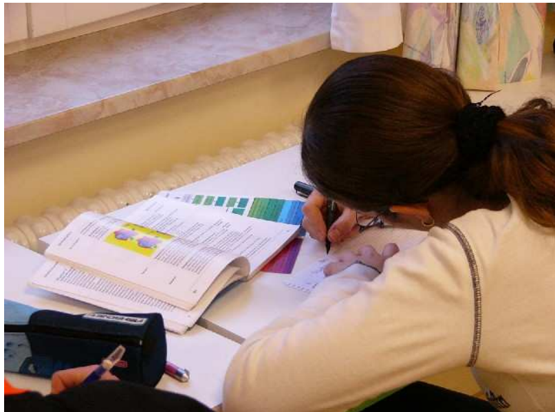
Freiwilliges Selbststudium am „freien“ Ausbildungswochenende.

Gerade im Schulsanitätsdienst erfahren die Schüler immer wieder, wie wichtig ihr eigenes Handeln, genaue Vorbereitung, Fachwissen und Training für ihre persönliche Weiterentwicklung ist. Sie sehen in ihrer Arbeit einen Sinn, verstehen, wofür ihr Lernen und ihre Arbeit wichtig sind und erfahren es permanent im Schulalltag – schließlich kann von ihrer Leistung und ihrem Können Leben und Tod abhängen. Wenn Schüler den tieferen Sinn ihrer Arbeit verstehen, lernen sie gerne, selbstständig, mit einem enormen Wissensdurst. Diese Erfahrung macht mir immer wieder deutlich, dass Schüler in geeigneten Situationen, in denen ihnen die Sinnhaftigkeit der Lerninhalte verständlich ist, gerne lernen und mehr erfahren wollen.