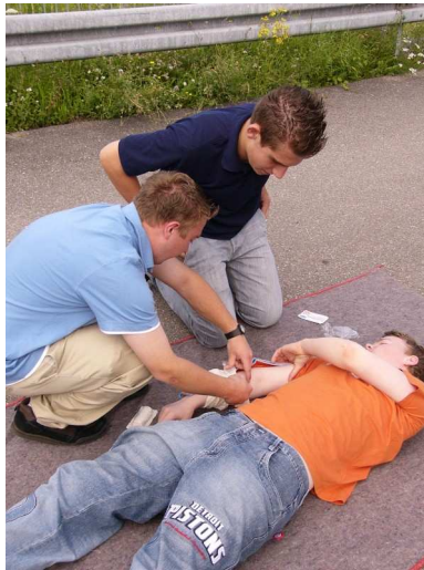
Erfahrene Schulsanitäter bilden neue Sanis aus.

Gerade am letzten Ausbildungstermin wurde mir deutlich, dass Schüler besondere Leistung bringen, wenn sie von einander lernen. Ich konnte prinzipiell mehr Fachwissen vermitteln als die Jahre zuvor. Die Schüler haben sich gegenseitig auf abwechslungsreiche Art und Weise selbst ausgebildet. Sie hörten sich ab, erklärten, trainierten ihre Kompetenzen in Fallbeispielen. Hier wurde mit „Kopf, Herz und Hand“ gelernt.